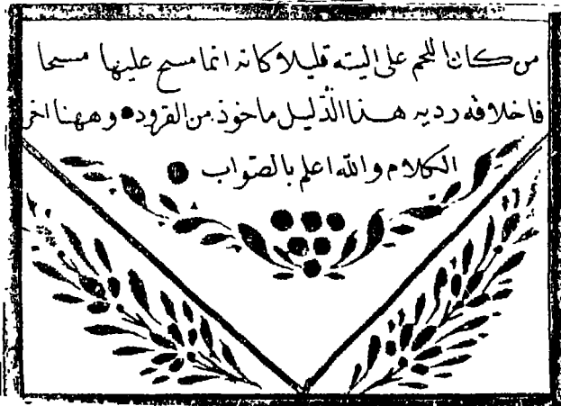
الصفحة الأخيرة من المخطوطة